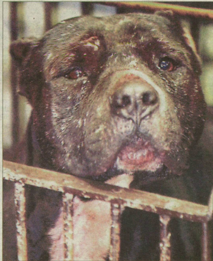
A kutyát a gazdája vadíthatja el.

Harci kutya hivatalosan nem létezik. Annak idején a nevezetes törvény hatására összesen két budapesti tenyésztő nyilatkozott arról, hogy állatait harcra képezte ki. Azt Kiss Antal, a Magyar Ebtenyésztők Országos Egyesületének szegedi elnöke is leszögezte, hogy a harci jelző nem köthető egy adott fajtához. – A rosszul tartott kutya harap és agresszívvá válhat. Minden általam ismert tragikus esetben lakásba, kis udvar-