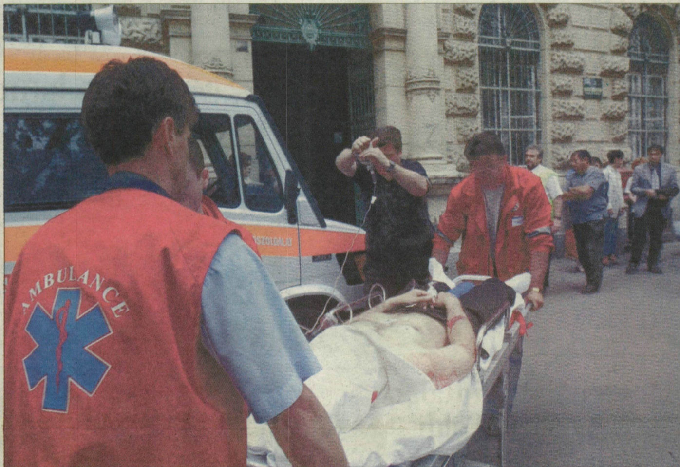
A mentősök és az orvosok már nem tudtak segíteni, a férfi a kórházba szállítás után életét veszítette.