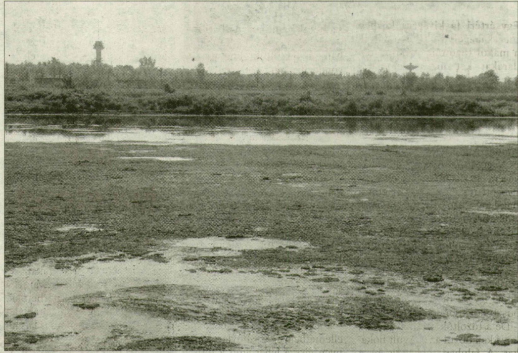
Több száz köbméternyi sertés-telep párolg a várostól szinte kőhajításnyira.