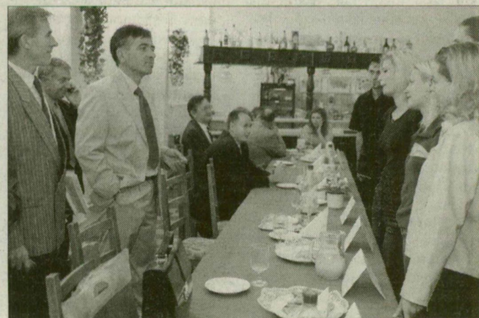
Böven akadt érdeklődő.