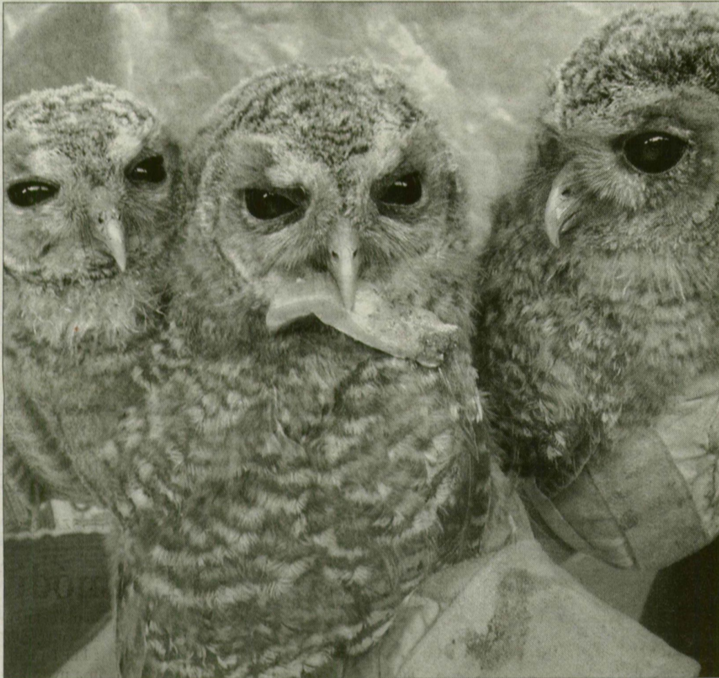
A madarak gyorsan megnöttek a három hét alatt.