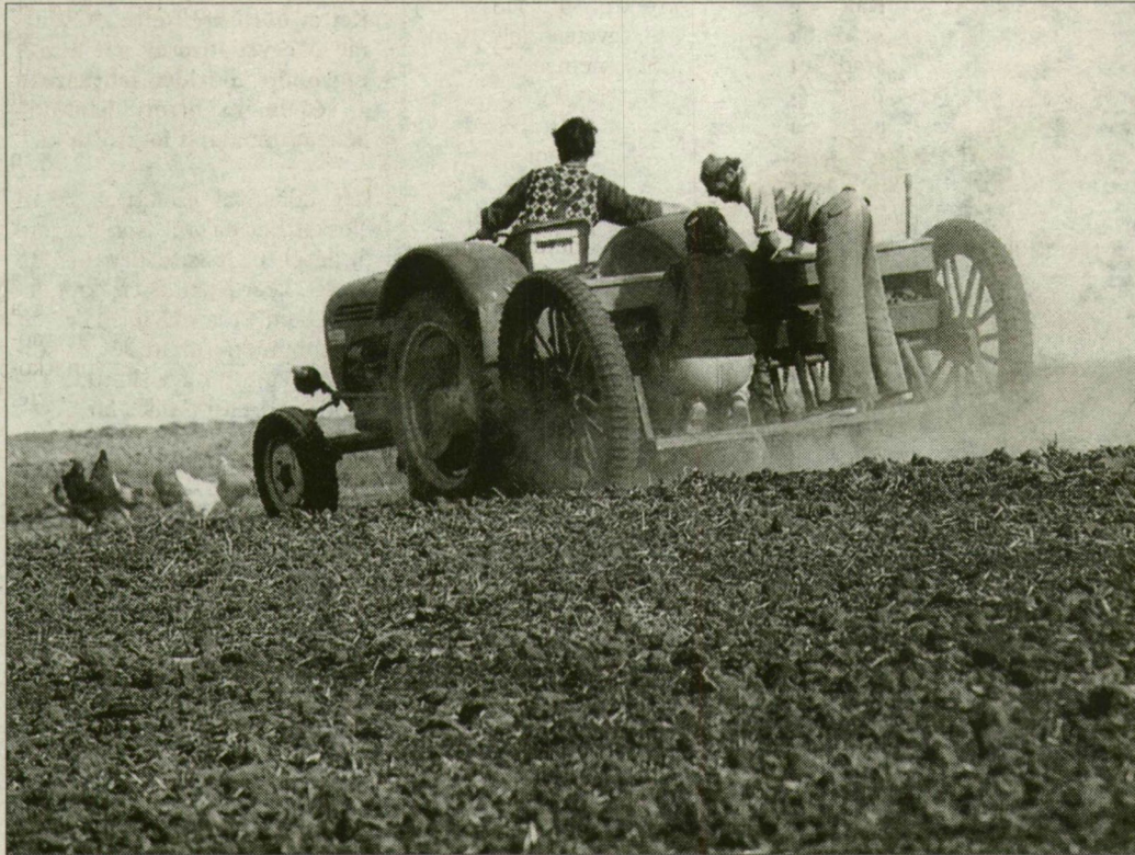
Szenved a föld, szenved a gép, szenved az ember.