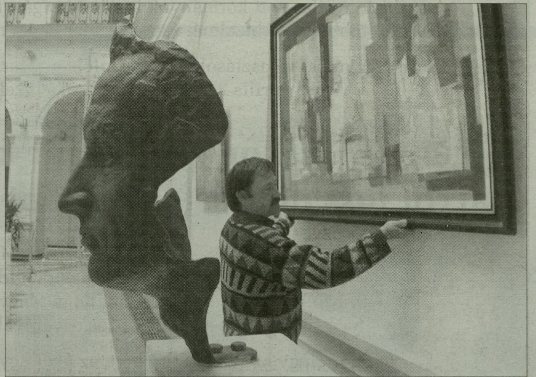
Az alkotók a Démász-székházban.