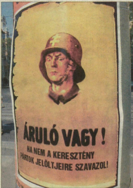
A város legforgalmasabb helyein ragasztották ki az eredetileg a háború utáni választásokon használt plakátok reprodukcióit.