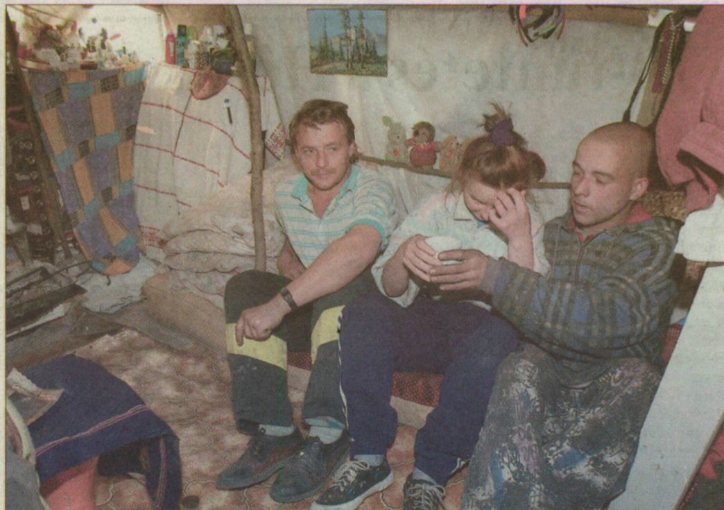
Polgári szokás az erdőben: délutáni kávézás a gát melletti kunyhóban.