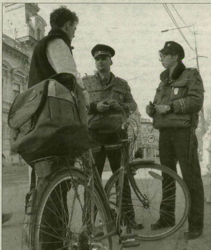
Rendszeresen ellenőrzik a kerékpárosokat.