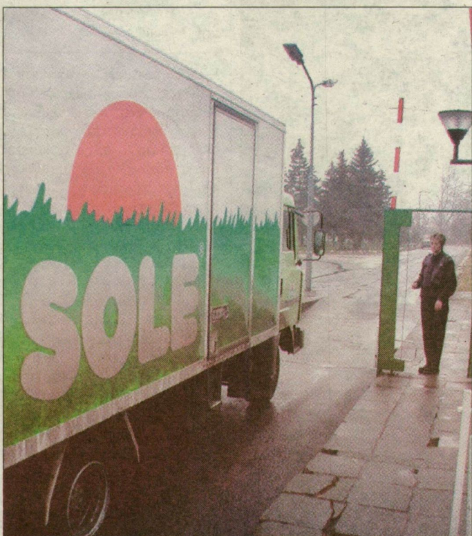
Szegeden nem értik a cég termékeit ért vádakat.