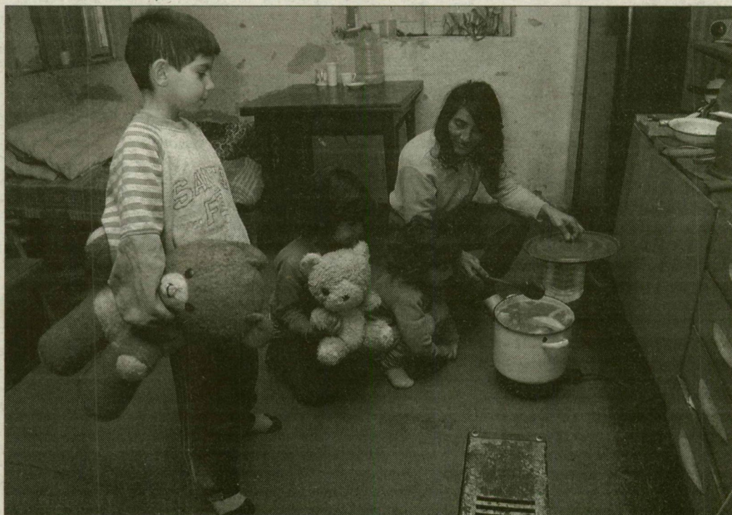
Az édesanya ebédet főz a családnak.