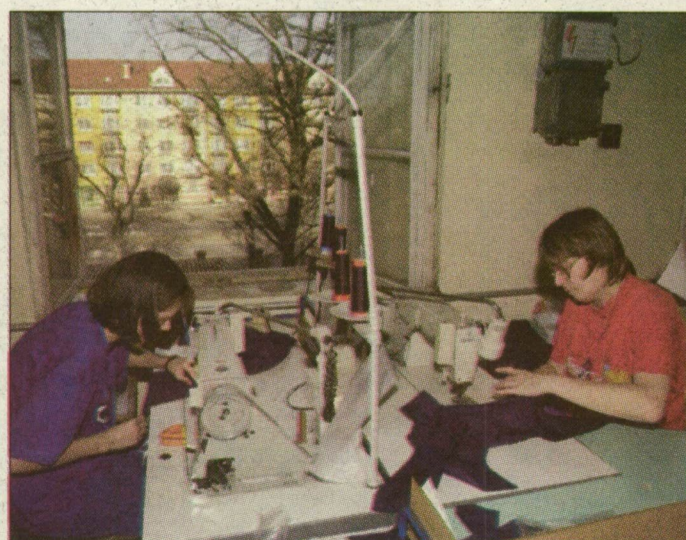
Munka közben. Kilátás a varrodából.

A gyár és a négyszáz dolgozó számára a jelenlegi körülmények között a legjobb megoldás született. Az azonnali leállással nemcsak munkájukat veszítették volna el az emberek, hanem végkielégítést sem kaphatták volna meg, hiszen a mintegy 190 millió forintnak információink szerint hiány-