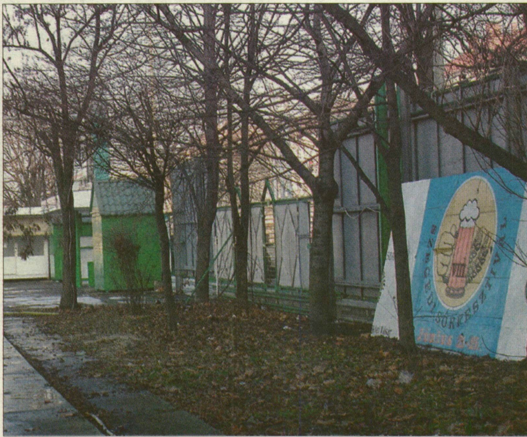
A Mars téri kiállítás fölött eljárt az idő.

A Szeged Expó tavaly elbúcsúzott a Mars tértől, s azóta többször elhangzott, hogy a városi vásárok