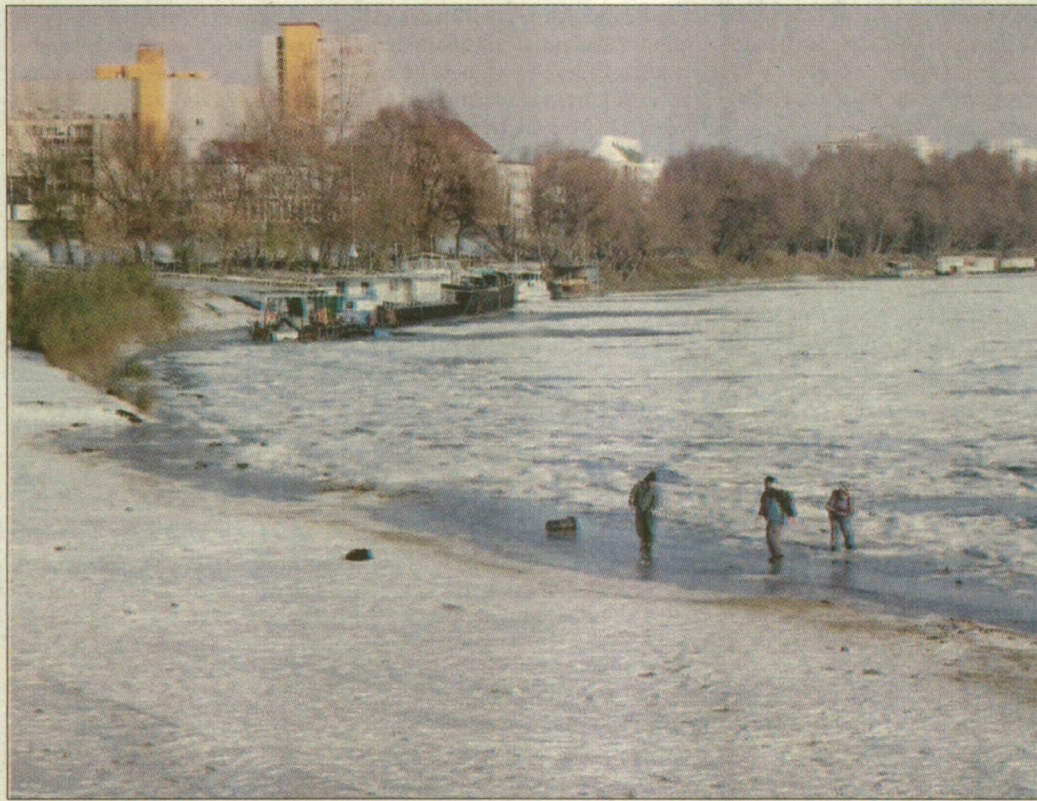
A jég akadályozza az árhullám levonulását.