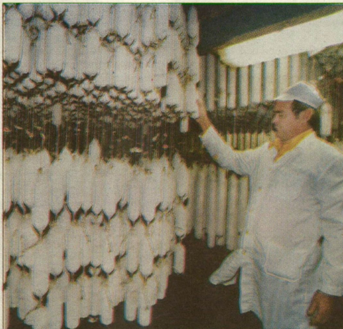
A Pick szalámi érleléséhez idő kell. Az ország legnagyobb húsipari cégcsoportja körül felgyorsultak az események. Fotó: Gyenes Kálmán

Mivel a felügyelet és a cég közötti alku eredményeként az Arago papíronként ötszáz forinttal többet fizet a pakettért, ezért csak akkor érdemes megvenni a saját részvényeket, ha azzal biztosítható a kilencven százalék fölé kerülés és a többi tulajdonostárs kiszorítása. Amennyiben ezzel a 7,4 százalékos sajtó részvénypakettel sem érné el az Arago a kilencven százalékot, felesleges 1,1 milliárd forintot kiadnia, jobban jár, ha a Pick inkább bevonja a papírokat.