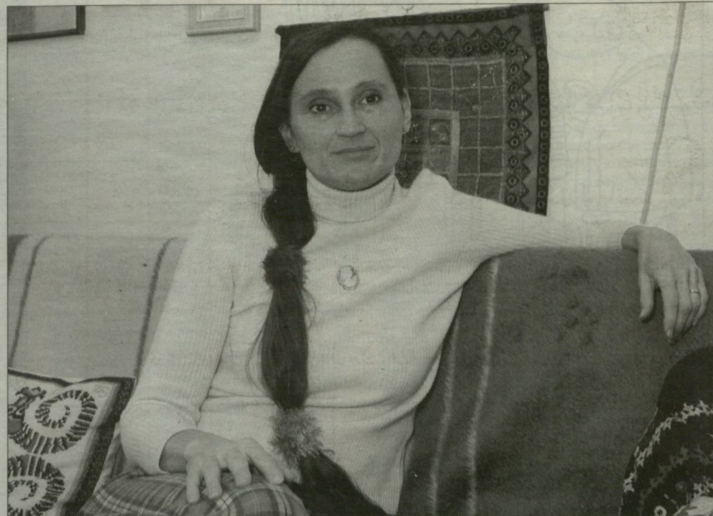
■ Másként gondolkodom, mint általában az emberek.

Erettségi után Prágában szeretett volna bábervezést tanulni. Erre a szakra azonban kétfévente csak egy embert vettek fel Magyarországról. Nem sikerült kijutnia, ezért a szegedi tanárképző biológia-rajz szakát választotta. A főiskolán szerettet bele a rajzfilmbé, ezért diploma után a kecskeméti stúdióba ment dolgozni. – Az ott eltöltött négy év jó iskolának bizonyult, mert a mindennapos szakadatlan rajzolásnak köszönhetően nagy gyakorlatot szereztem. Sokféle munkám volt, például Jankovics Marcell filmjein dolgoztam, nagyon szerettem a magyar népművészeket, a Mátyás király-, a Dr. Bubó- és a Vízipók-sorozatot. Akkoriban még létezett magyar rajzfilm, ma már szinte nincs. Néhány év múltán szűknek éreztem a kereteket. Több ötletem volt, kreatívabbnak tartottam magam annál, mint amire ott lehetőségek nyílt. Férfiem újságíró, így sokan megfordultak nálunk, amikor a kollégái meglátták a fiókknak szánt szatirikus rajzaimat, biztattak, hogy rajzoljak karikatúrákat. Az első munkáim 1985–86-ban az Ifjúsági Magazinban jelentek meg. Egyre több felkérést kaptam, és egyszer csak azt vettem észre, hogy tényleg karikatúrákat készítek. Végül a Kurír szombati szati-