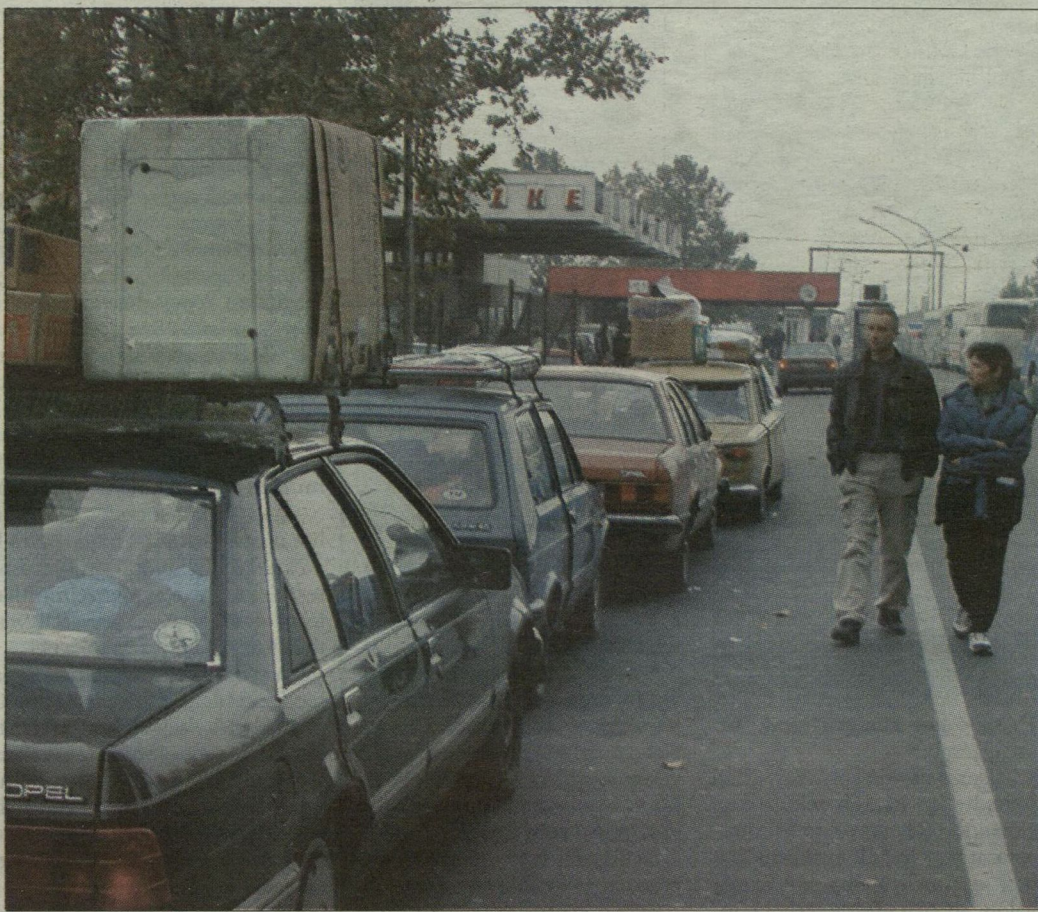
A határ menti „magánimport-üzletág” az ünnepek előtt sem szünetel.

– Azt persze nem állíthatnánk, hogy a határ menti magánimport meg is szűnt – folytatta Csóti Gábor –, hiszen ebben a hónapban már több mint 4 ezer alkalommal fordultak hozzánk áfa-visszatérítési igényrel az utazók. Vagyis nem kevés azok száma, akik egy-egy útkon 50 ezer forintnál nagyobb értékű csomaggal utaznak vissza Jugoszláviába. A számlákból egyé-