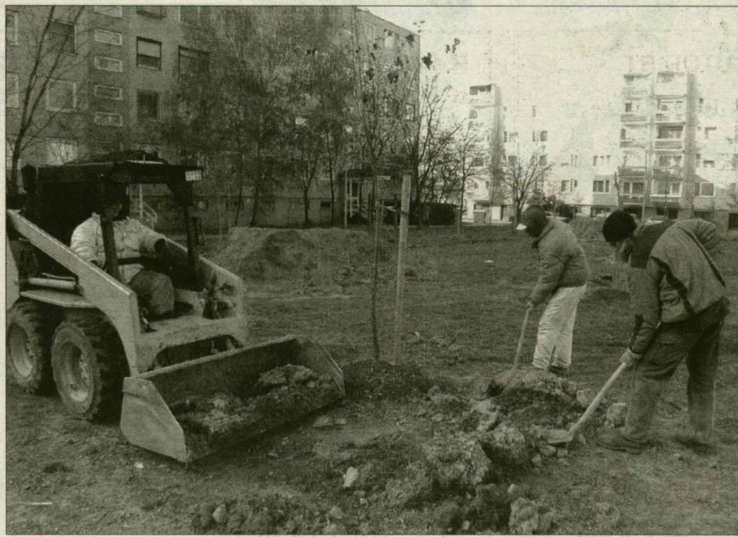
A Zsitva soron a hét végén is dolgoztak a faültetők.