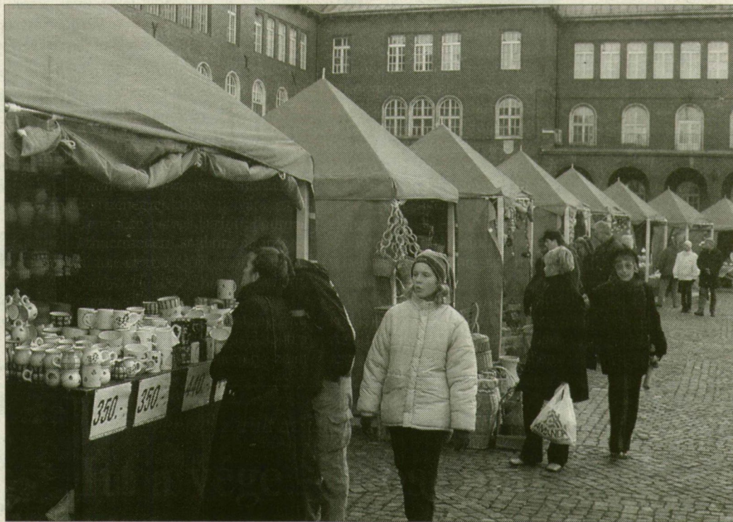
A Dóm téri vásár igazi kikapcsolódást nyújt. Hangulata méltó az ünnephez.