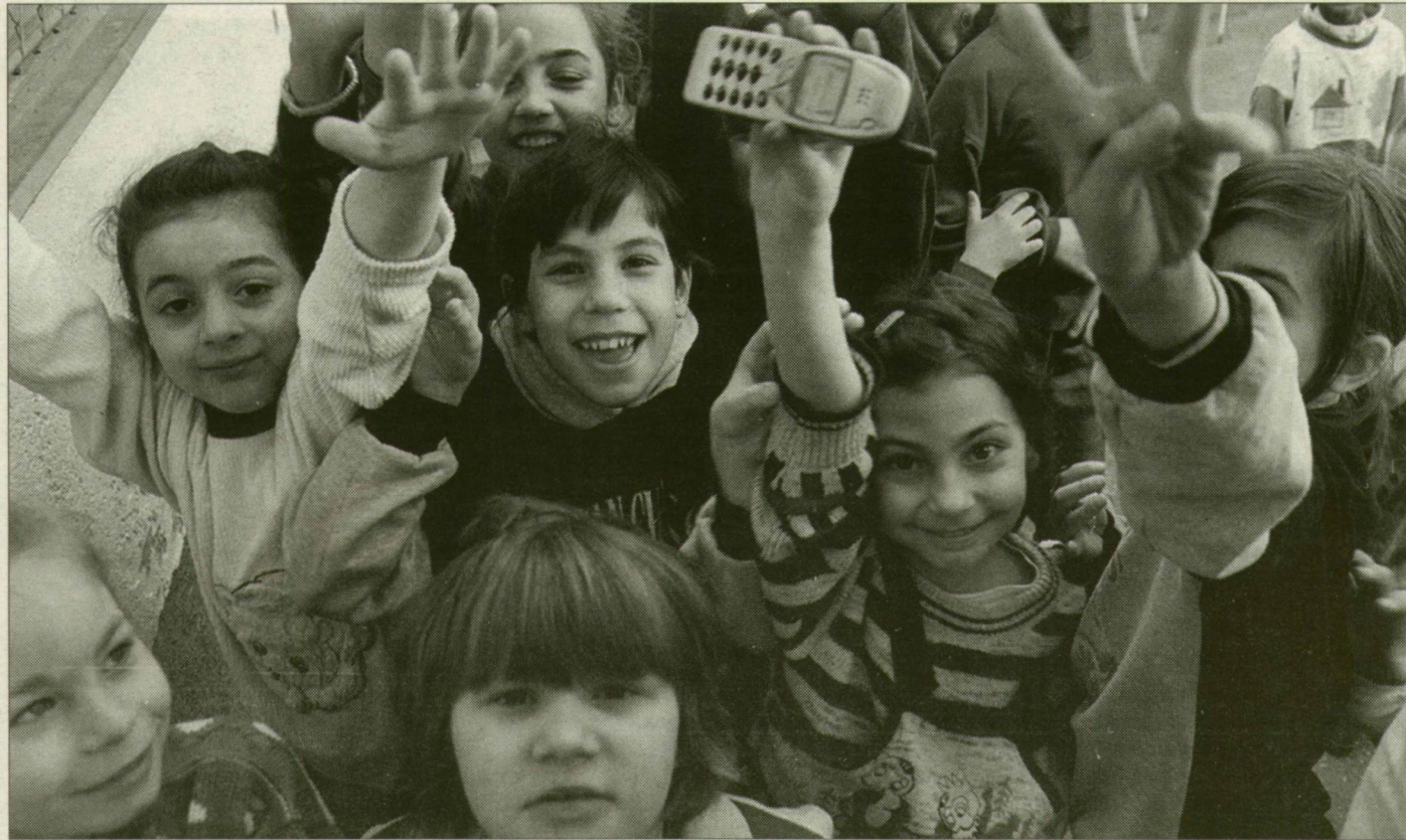
A kicsik egyformának látják egymást – a gyerek az gyerek.