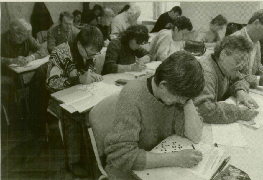
Közel százan vettek részt a versenyen.