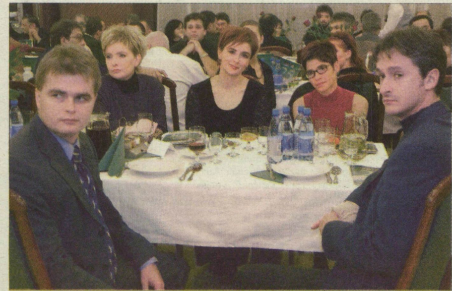
A szegedi stúdió munkatársai a Forrásban.