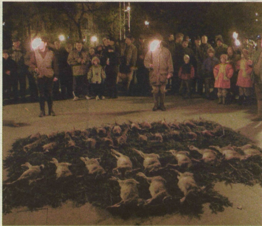
Ünnepélyes terítékbevetés a Kossuth téren.

Szent Hubertus-mise, hangverseny, vadászat, ünnepélyes terítékbevetés. Ennek jegyében telt Vásárhelyen a hétvége.