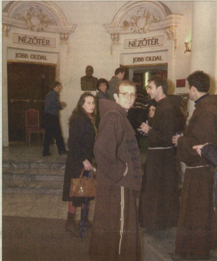
Szerzetesnővendékek a színház előcsarnokában.