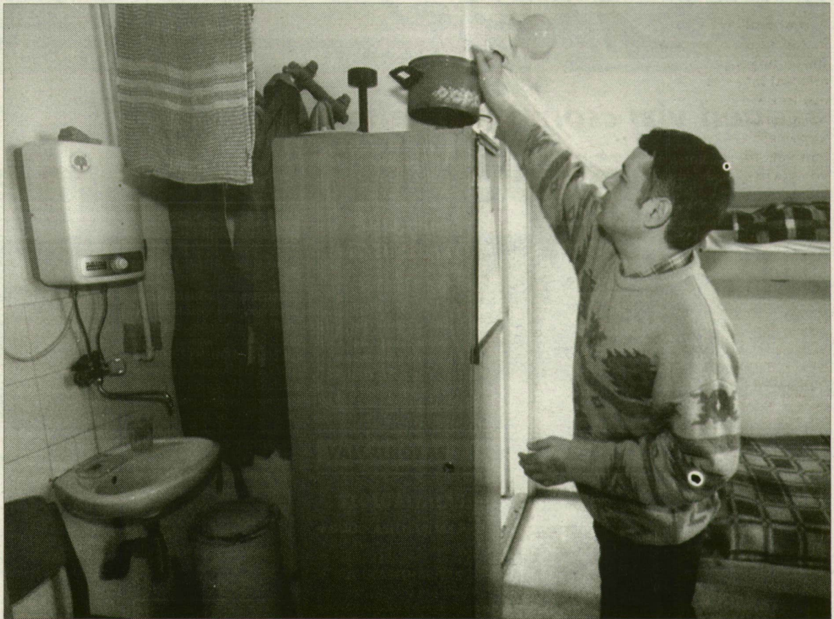
A szálláson főzhet, tisztálkodhat is a hajléktalan.