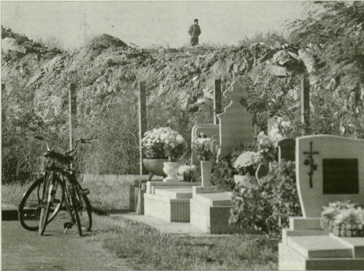
A csongrádi kommunális hulladék legfeljebb még egy éven át helyezhető el a városi „szeméttelép”.

A szolgáltatóknak egyre több gondot okoz, hogy a szállítójárműveiknek a lerakón belül mintegy ötszáz métert kell megtenniük. Tartósabb eső után ez esetenként lehetetlen feladatnak bizonyul. Ráadásul a cégtől függetlenül behordott hulladék önkényes elhelyezése miatt a kialakuló két belső utak rendezésére is egy-