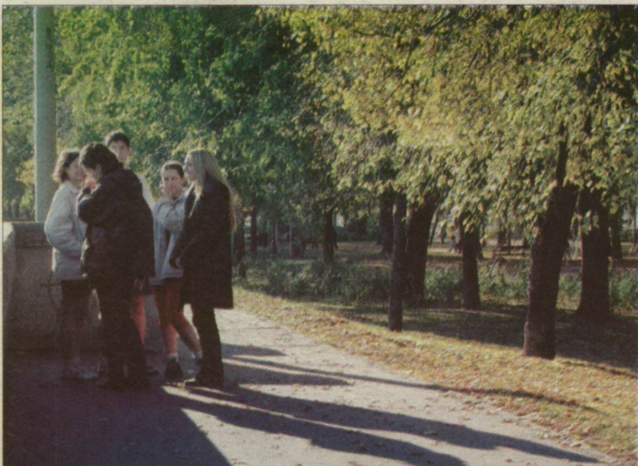
A fiatalokat a városról alkotott véleményükről is megkérdezték.