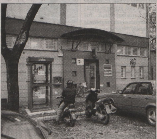
A Dr. Boross József utcában raktárbázis és restaurátorműhely alakítanak ki.

forintot költ a kórházak gép-és műszerbeszerzésére. A szentesi kórház diagnosztikai és sürgősségi tömbjének kialakítása a tervezett határidőnél egy évvel korábban elkészül, az egymilliárd 264 millió forintos beruházásból 126 millió forint a megye saját hozzájárulása, a többi címzett állami támogatás. A makói kórház rekonstrukciójához 151 millió forintos önerő mellett a megye 1 milliárd 360 millió forintos támogatást nyert, az építkezés februárban indul. Elkészül majd egy négy szintes, 4 ezer négyzetméteres új épület, amit a kórház megmaradó részeivel összekötnek. A deszki szakkórház felújítását a kormány nem támogatja, a pályázatot ismét benyújtják, szükség esetén a legsürgetőbb munkákat saját erőből is elkezdik.