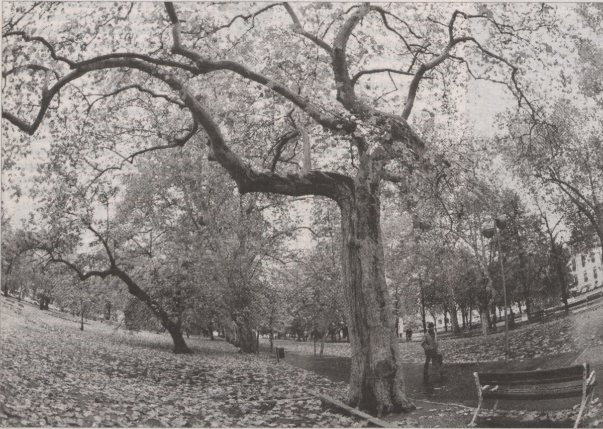
Összel a legszebbek az évszázados platánok

Hamarosan kezdődik a szegedi Széchenyi tér hatéves farekonstrukciós programja. A beteg, vagy rossz helyre telepített fákat kivágják, helyükbe – a növények terigénye szerint – egészséges, koros fákat telepítenek. Idén ősszel összesen tizenhat fát emelnek ki.