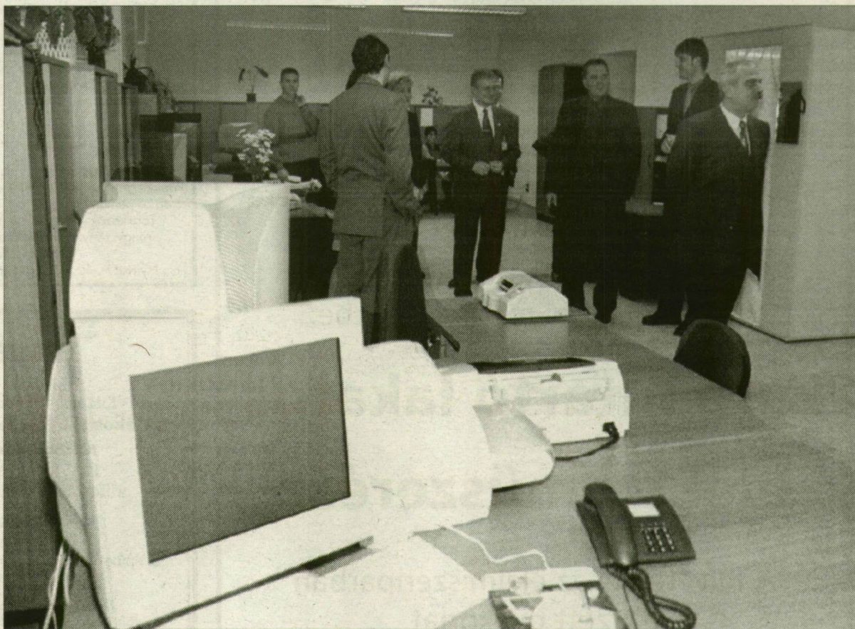
Mától a Huszár utca 1. szám alatt várják az ügyfeleket.