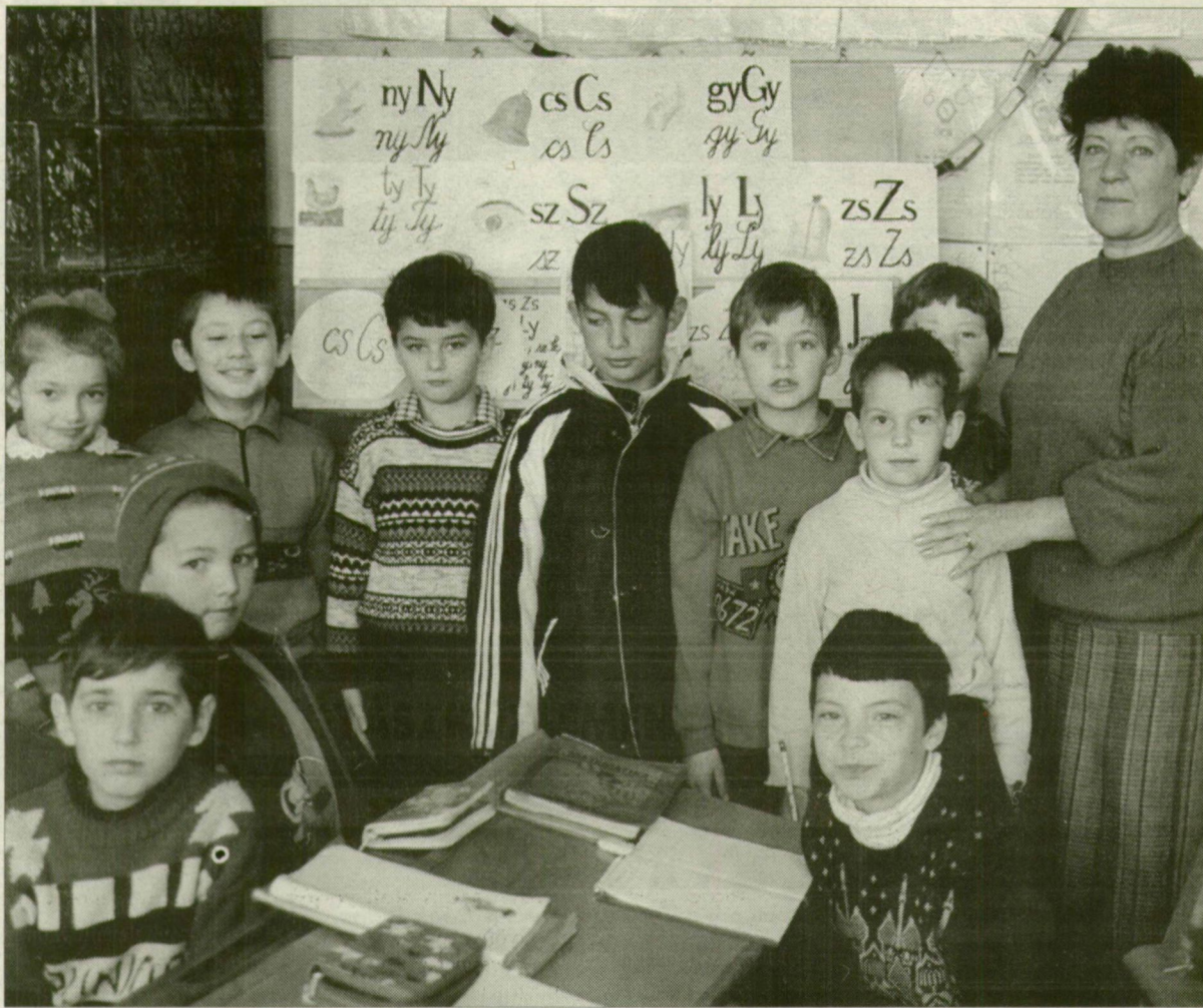
Az örökbefogadó szülők legtöbbször a gyermekek nemét nem határozzák meg. (Schmidt Andrea illusztrációja)

Országosan tavaly 949 esetben engedélyeztek örökbefogadást, melynek hatvan százaléka titkos volt. A népszerűség egyik oka, hogy ez utóbbinak lényegesen nagyobbak a jogi garanciái. Ebben az évben a szegedi gyámhivatal hat esetben titkos, míg kilenc nyílt örökbefogadást engedélyezett. A tapasztalatok szerint a leggyakrabban olyan középkorú házaspárok jelentkeznek örökbefogadó szülőnek, akiknek valamilyen okból nem lehet saját gyermekük. Többnyire egy gyermeket, de előfordul, hogy testvér-