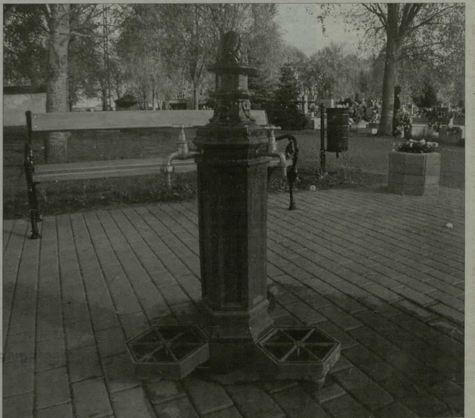
A temetőbe járó mindszenti évről évre kulturáltabb körülmények között látogathatják elhunyt hozzátartozóik nyughelyét.

A Mindszenti temető – amelynek bejáratát gyönyörű, faragott kapu is díszíti – így meggyeszte a legszebbek közé tartozik.