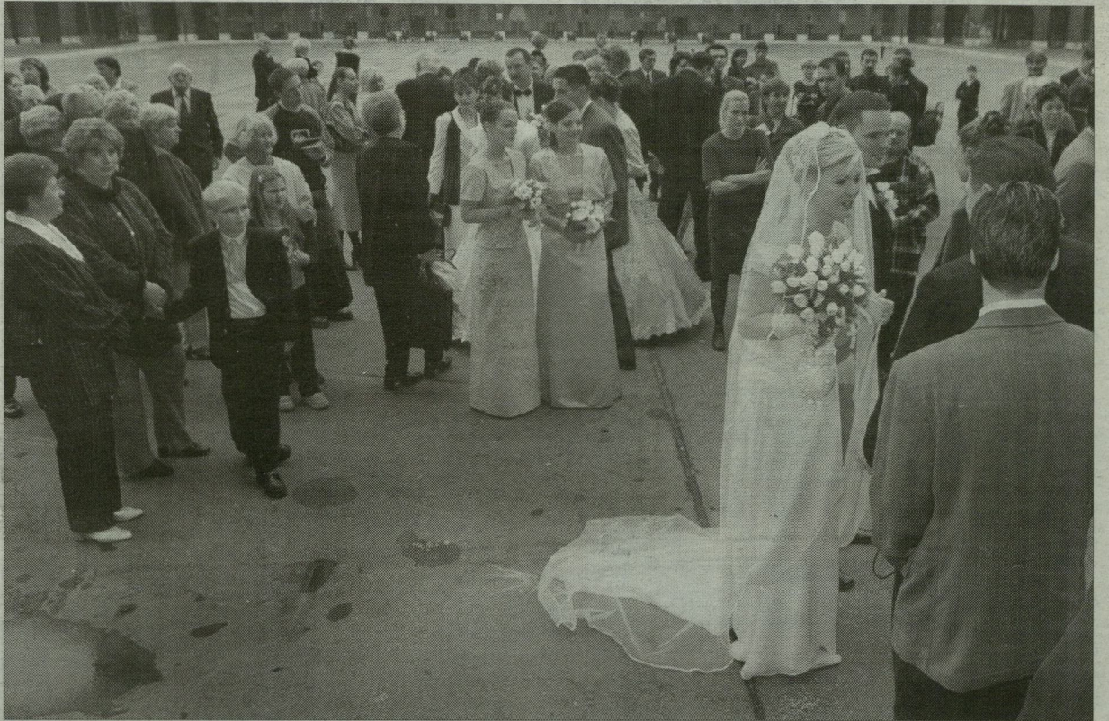
Sztáresküvő a közelmúltból. Sok pénzbe kerül a körítés.

Szinte lehetetlen felsorolni, hogy mit kér, azt pedig teljesen lehetetlen, hogy mit kérhetné az ifjú pár, hogy elsősorban nekik, de persze mások számára is emlékeztető maradjon az a pillanat, perc, óra, nap, amikor elhangzanak az igenek és férj-feleség lesznek. Természetesen ha nem fontos a rongyrázás, akkor olcsón, akár ingyen is megúszható a valamikor még megismételhetetlennek tartott ceremónia, a házasságkötés.