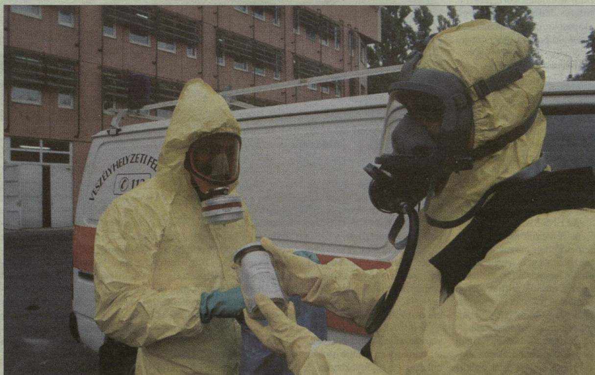
A Csongrád Megyei Rendőr-főkapitányságra bevitt küldemény már jó helyen, a veszélyhelyzeti felderítők kezében.

Munkatársunktól Eddig húsz esetben riasztották Csongrád megyében gyanús küldemények miatt a katasztrófavédelmi igazgatóság ügyeletét. A veszélyhelyzeti felderítő csoport munkatársai begyűjtötték a leveleket, csomagokat, és átadták az ÁNTSZ-nek. Az október 23-ai ünnepek alatt a posta nem