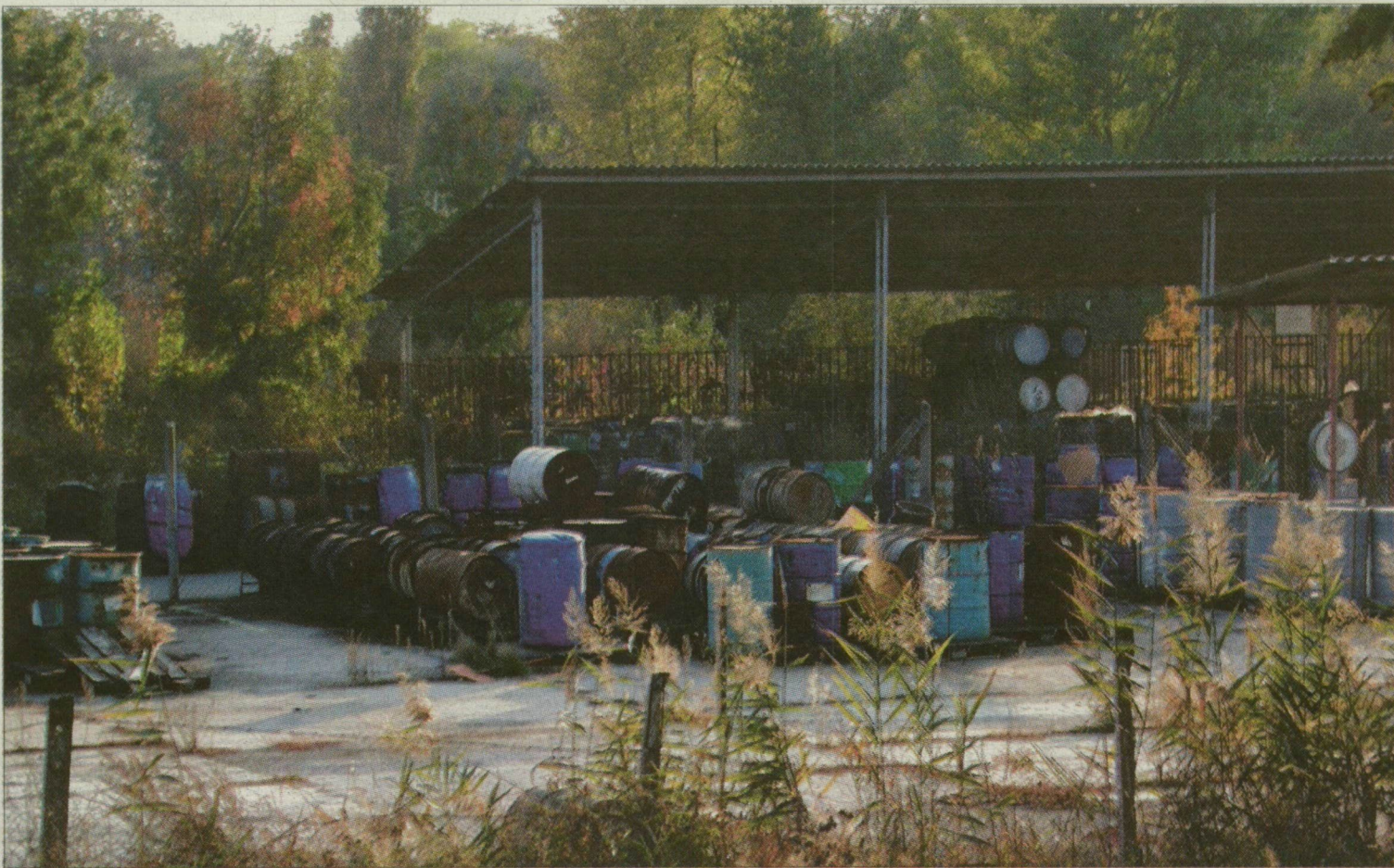
Halomban állnak az öreg hordók a bezárt telepen.

Bejelentést tett egy ismeretlen a Szegedi Városi Ügyészségen, miszerint a Budalakk Titán Festékgyártó Kft. évekkel ezelőtt bezárt. Bajai úti telephelyén környezetszennyezés-gyanús állapotok uralkodnak. Egy, az ügyészséghez eljuttatott videokazettán felburok, rozsdáta hordókból kiömlő ragadós any-