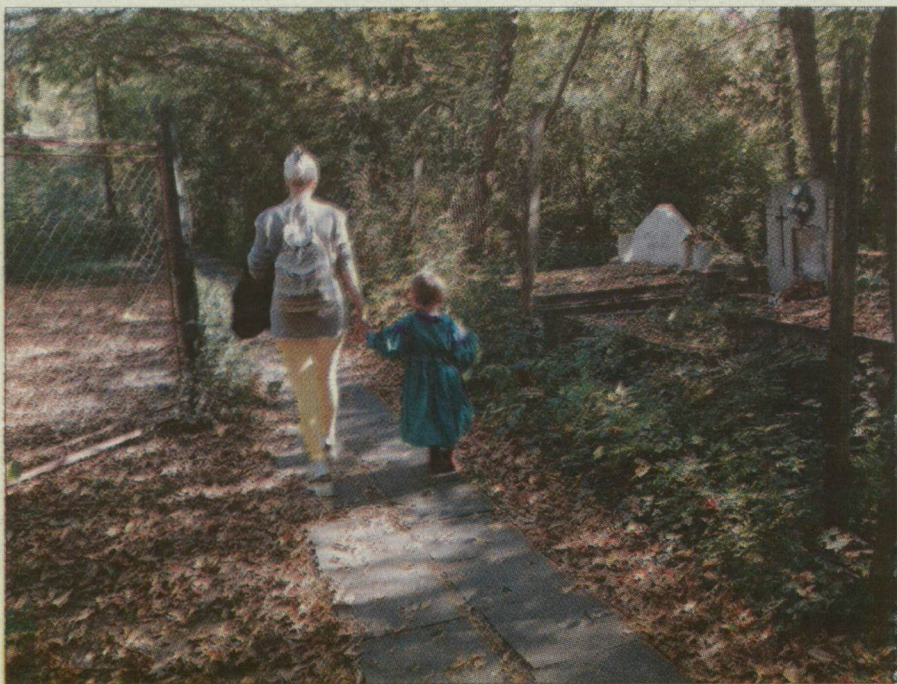
Jövőre akár építhetnek is a sírok helyén.