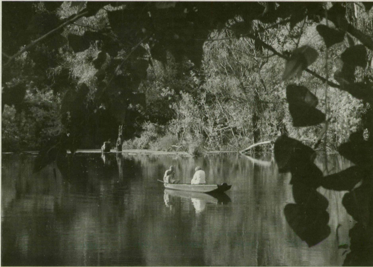
A mártélyi tájvédelmi körzetet harminc éve hozták létre.

Huszonöt éves a pusztaszeri, és harmincesztendő a mártélyi tájvédelmi körzet. A Kiskunsági Nemzeti Park vezetőse e kettős jubileum alkalmával járta végig a két területet a minap. Mártélyon előadást is meghallgattak a természetvédők az egykori foki, hullámtéri gazdálkodásról.