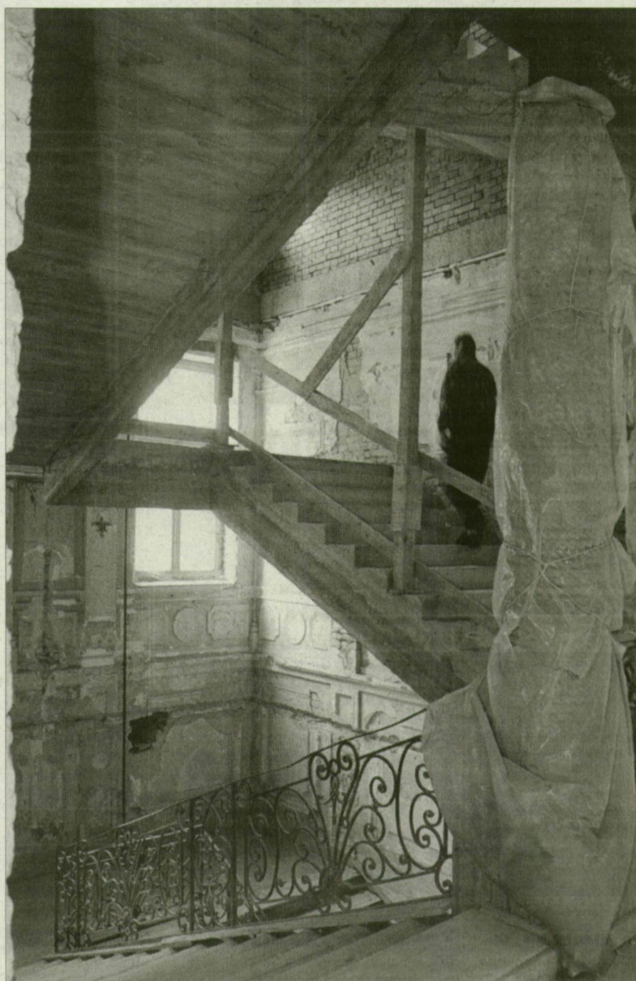
Akad még barkácsolnivaló, hogy megnyílhasson itt a Kaszinó.

Ma Magyarországon már csak öt kaszinó várja a játsszani szándékozót: három Budapesten, egy Szentendrén, egy pedig Sopronban. Szegeden 1991 és 1995 között működött kaszinó a Bartók Béla Művelődési Központ épületében. A közelmúltban úgy módosították a szerencsejáték-törvényt a két éves költségvetésben, hogy lehetővé vált koncessziós pályázat kiírása nélkül is kaszinóengedélyeket kiadni, ha azt száz százalék állami tulajdonban lévő játékszervező társaság, vagy többségi állami tulajdonban lévő gazdálkodó szervezet kéri. Ezzel a lehetőséggel élve a Szerencsejáték Rt. a jövő év első felében Szegeden is szeretne kaszinót nyitni – tudtuk meg Siska Andrástól. A Szerencsejáték Rt. Szegedi Területi Igazgatóságának vezetője lapunknak elmondta: a szerencsejáték üzemeltetésében jártas Andy Vajna-val kaszinónak alkalmas helyeket néztek meg. Felkeresték a Royal és a Tisza Szállót, a Bounty Pubba, valamint a régi Hungária Szállodába is elmentek, de a kaszinó helye-