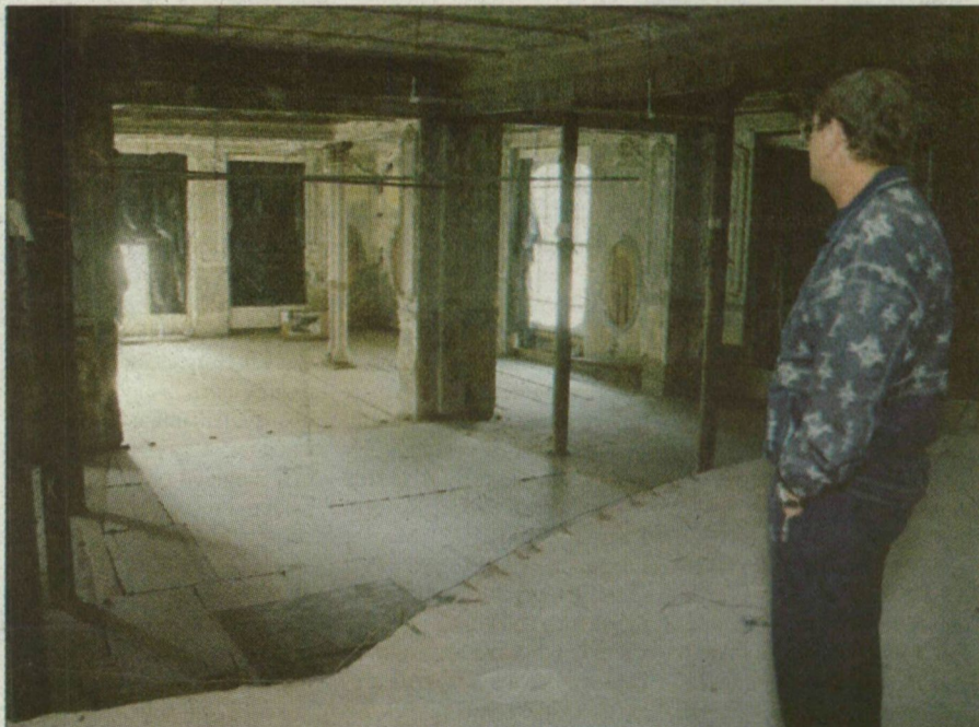
Keringőzők helyett rulettgolyó pörög majd a régi Hungária báltermében?