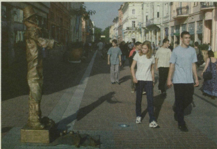
Négy utcaseprő takarítja majd a fölújított Kárász utcát és Klauzál teret.