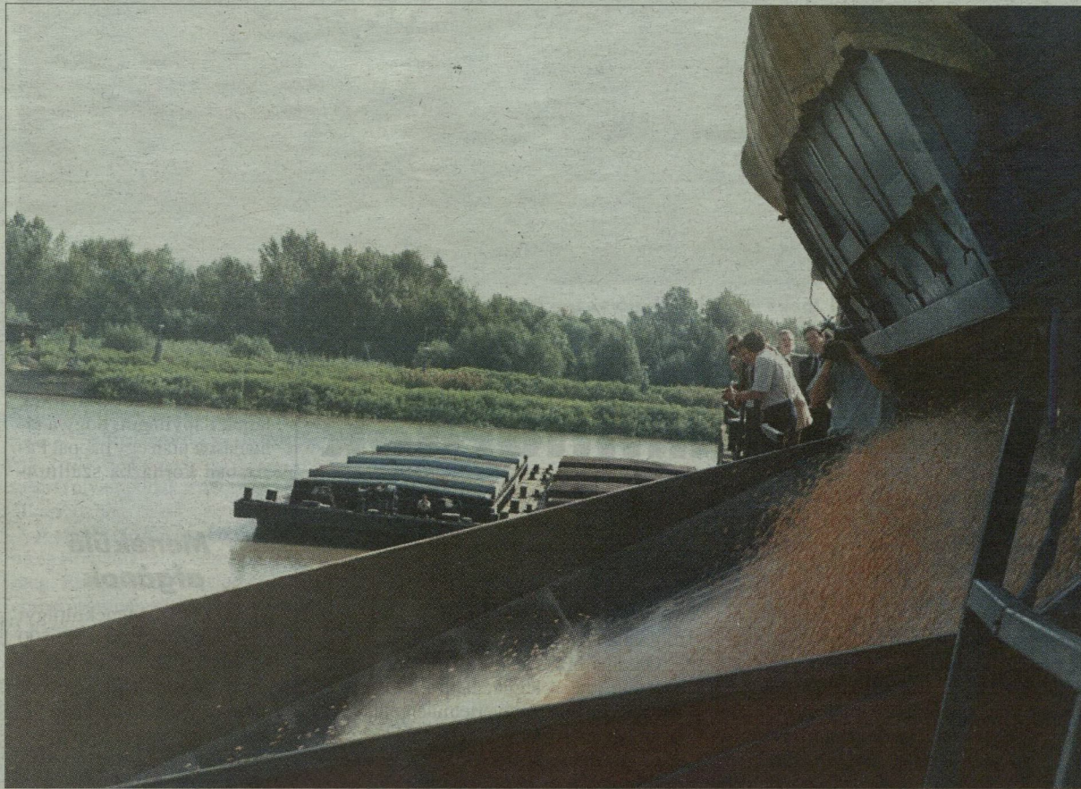
Csak egy mozdulat: a kukorica a teherautó platójáról az uszályba ömlik.

Ugyanezt hangsúlyozta Éder Tamás , a Földművelésügyi és Vidékfejlesztési Minisztérium (FVM) közigazgatási államtitkára is, aki többek között kifejtette: a szegedi medencés kikötő végre betöltheti azt a funkciót, amit a tervezőasztalon szántak neki. Emlékeztetett arra, hogy már a 60-as évek végén döntés született a szárazföldi és a vízi közlekedés csomópontjainak kialakításáról. Érdemi lépések azonban csak a 80-as években történtek, ám a folyamat kibontakozását a 90-es évek elején megakadályozta a délszláv háború. Jelenleg viszont éppen