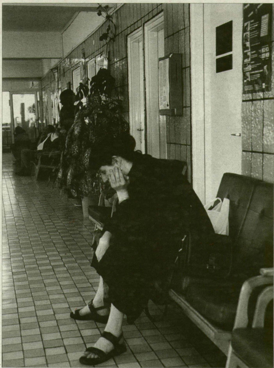
A beteg dönt arról, hogy tb-kártyáját melyik házi orvosnak adja.

Négy házi orvos egyelőre parkolóhelyt várja, hogy az önkormányzat szerződést kössön velük, s dolgozni kezdhessenek. A még szerződésre várakozó „négyek” minden szükséges dokumentumot, engedélyt beszereztek és azokat benyújtották az önkormányzathoz. Egyelőre ülnek és várnak, s mivel pályázati feltétel volt az önálló rendelő építése, van, aki eladta lakását, hogy megtegye a rendelőépítés anyagi fedezetét.