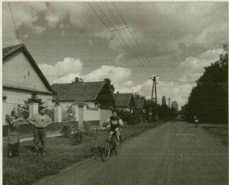
Székkutasi utca.

– Hogyne épültek volna! Azért volt mintafalu, hogy kövessék. A villamosítás