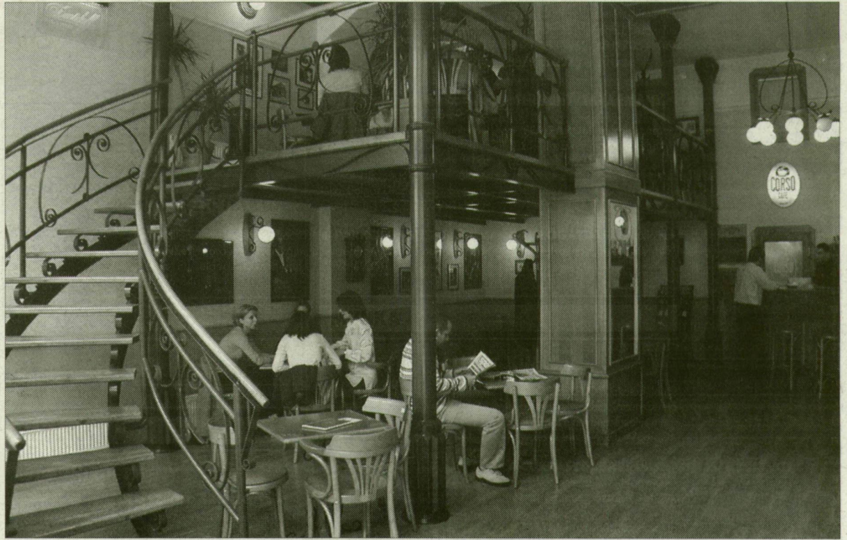
Kávéház a Kárász utcában. Albérlő nélküli bérlő, egyike a ritka kivételeknek.

Budapest V. kerületében, a Váci utcában egy üzlethe- lyiség bérleti díjának mérté- két több tényező is befolyá- solja – nyilatkozta lapunk- nak Tiba Zsolt főjegyző. A kerületben fekvő Váci utca külső övezetében egy üzle- helyiség éves bérlete 6500