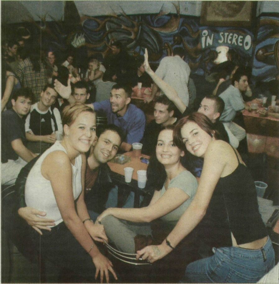
Illusztratív felvételünk a JATE-klub nyitóbüliáján készült a legnagyobb fennforgás pillanataiban.

Az őszi beköszöntével új élet költözik az egyetemi klubokba, s a jövő jogászai, közgazdászai, gyógyszerészei, vegyészei és asztalosinasai szabadulva az otthon melegségéből és a gúzsba kötött szülői tekintetektől, majdnem a hét minden napján hajnalig multhatnak, ha bírják fizikailag és anyagilag. A kis gólyákat most figyelmeztetjük a felsőbb évesek: a fáradtság, álmoság és másnaposság nem mentesít a szemináriumok és előadások látogatása alól. Ne tévessze meg őket az, hogy az egyetemen és a főiskolán nincs év eleji felmérés dolgozat (ahogy osztálykirándulás sem), s az első beígért zárthelyi dolgozatok időpontja a messzi távolban lebeg. Mert bizony sok megtévedt hallgató állt bebocsátásra várva a szorgalmi időszak első két hetében a JATE- és a SZOTE-klub előtt. Tömött sorokban. Este tízkor ugyanúgy, mint éjfélkor. Ráadásul milyen jó kedvük volt. Egyre csak ropták odabent. Nevetgéltek, ment a hóka-móka. A tévúton járók mohó örömmel fedezték fel egymást a vadonatúj évfolyamtársak a kavargó tömegben.