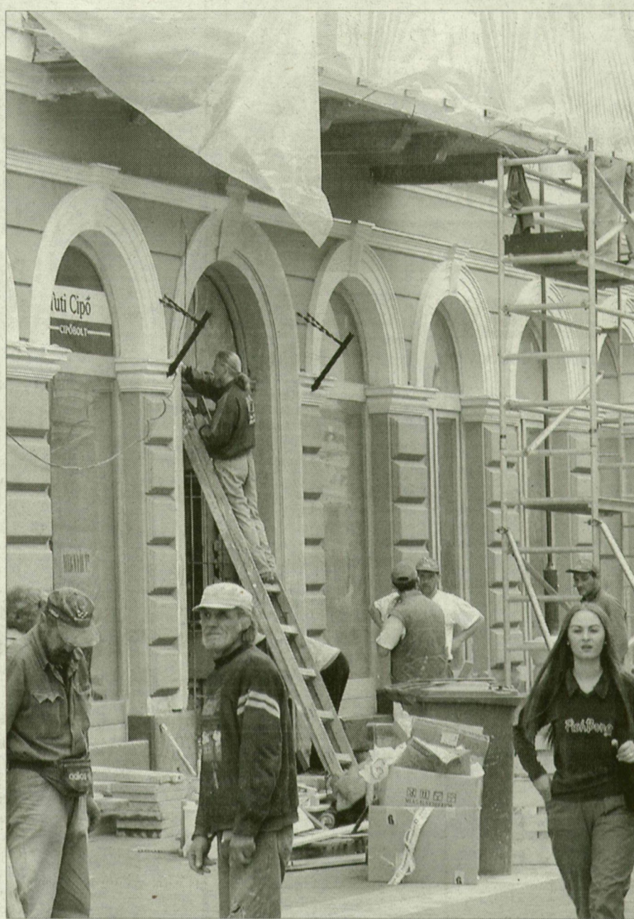
A korzó üzletei. Kimosakodnak a porból és a piszokból.

A figyelem középpontjában ezekben a hónapokban természetesen a Kárász utcai bérlők voltak, részint azért, mert ők rendelkeznek bérlői jogokkal a város legszebb pontján, de azért is, mivel forgalmukat érzékenyen érintette a díszburkolat építésével járó zaj, piszok, kényelmetlenség. Ennek ellenére egyetlen bérlő sem vette a sátorfáját és tette át székhelyét két utcával kijebbe, barátságosabb tájakra. Mindenki maradt a helyén. Hogy egyik-másik üzlet portálja és profilja megváltozott – például éppen a múlt héten adta át új üzletét a Vodafone –, mind-