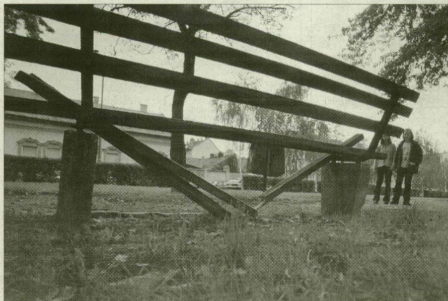
Három padot rongáltak meg az ismeretlenek.

A környezetgazdálkodási kht. egyébként tavasztól tervezi a parkőri rendszer visszaállítását, hogy megelőzzék az ilyen és az ehhez hasonló cselekményeket.