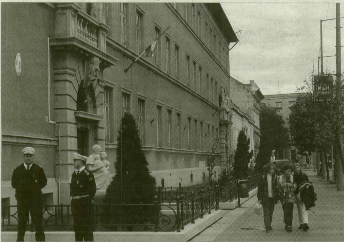
A rendőr láttán a gyerekek minden szabályt betartanak.

Szegeden, Deszken és Rőszkén összesen tizen-négy iskola előtt vigyáznak rendőrök a diákok biztonságára. Tavasszal sikeres volt a hasonló kezdeményezés. Az iskolák előtt az elmúlt évihez képest 45 százalékkal kevesebb baleset történt. Ezért is döntött úgy a rendőrség, hogy szeptemberben megismétli a bűn- és baleset-megelőzési akciót.