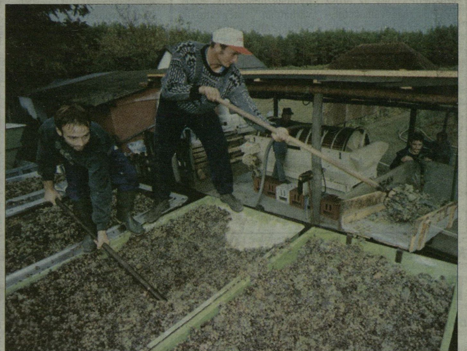
Hol van már a tavalyi szőlő Ásotthalmon?