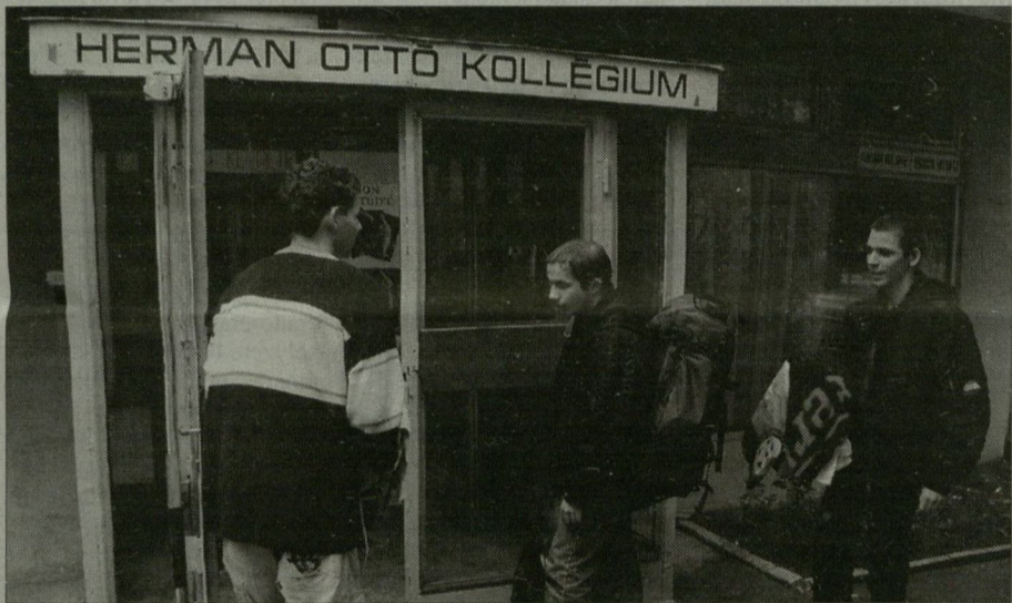
Vége a nyári szünetnek, költöznek a diákok a kollégiumba.