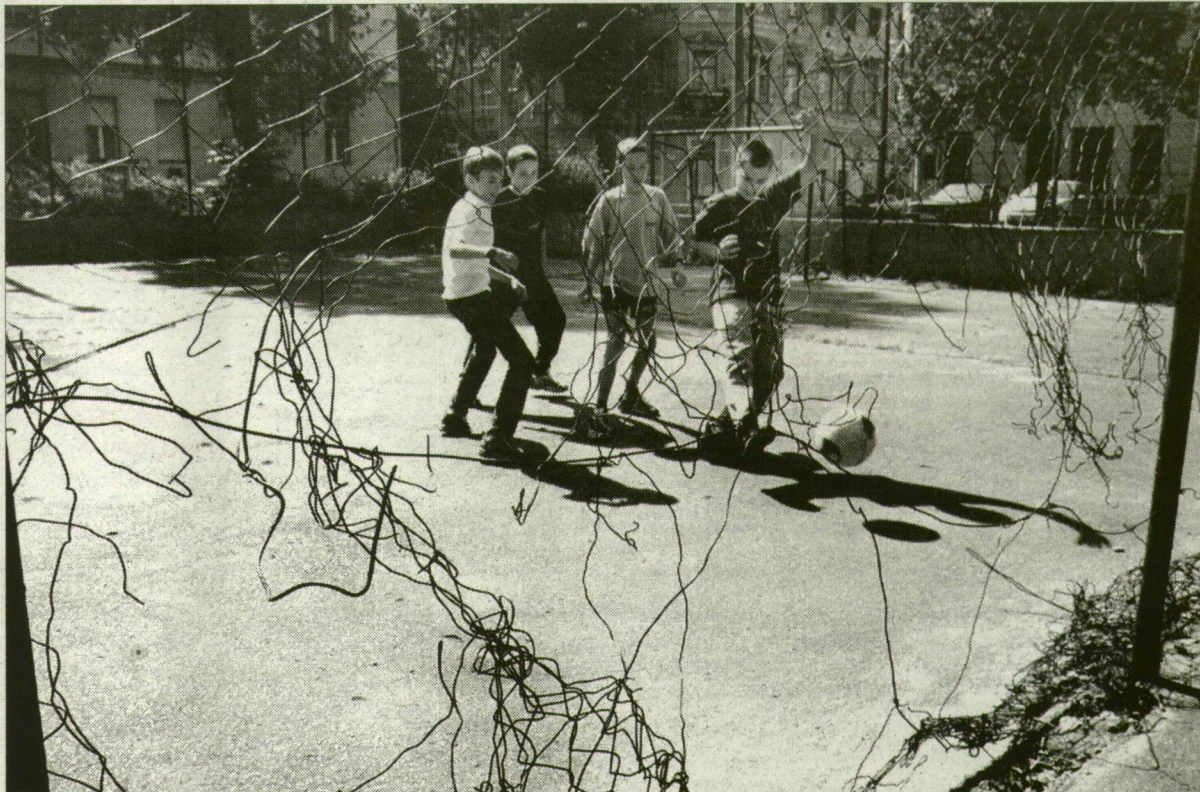
A focipálya jelenleg szinte használhatatlan. A városnak nem kerülne pénzbe a műfüves focipálya.

Felújítaná, majd vállalkozói alapon működtetné a Mandíner Kft. a Bartók téri focipályát. Az önkormányzat évi egymillió forintot kér a terület használatáért, a „nyertes” azt állítja, ezt már képtelen kigazdálkodni. A közgyűlés legutóbbi, pénteki ülésén döntött a terület használati jogának bérbeadásáról. Közben a Szepark igazgatója az eredeti fejlesztési elképzeléseknek megfelelően tanulmánytervet készít a tér másik felén kialakítandó parkról.