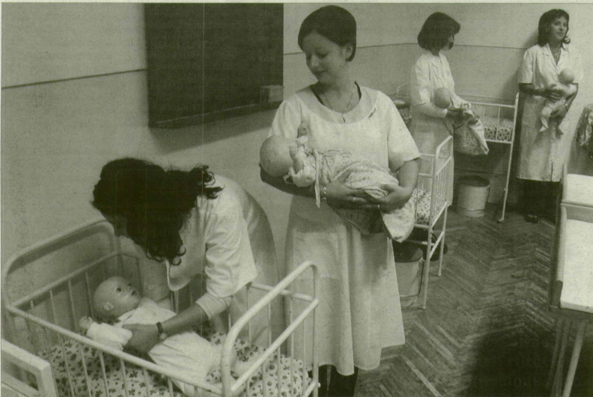
Csecsemő- és kisgyermekápoló szakos tanulók a Kossuth Zsuzsanna szakközépiskolában.

Több éve utánpótlási gondokkal küzd az ápoló szakma hazánkban. Egyes szakemberek szerint néhány esztendő múlva kritikus helyzet alakulhat ki, ha a kórházak és a klinikák szakképzetlen munkatársakat lesznek kénytelenek felvenni a betegek gondozására. Úgy tűnik, ennek veszélyét egyelőre sem a szakma, sem a társadalom nem ismeri fel elég-gé.