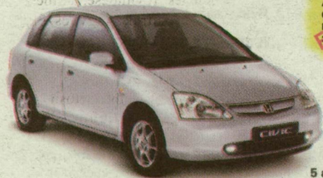
5 ajtós Honda Civic Sport