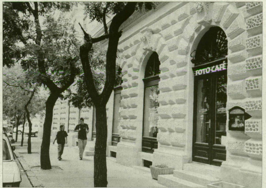
Néhány hónap után bezárt a szegedi Foto Café, de csak azért, hogy újra kinyithasson.

Szegeden nem jellemző, hogy a turistaszezon befejezése után kávéházak, éttermek, cukrászdák szüneteljenek működésüket. A nyár végével szinte senki sem adja vissza működési engedélyét. A Deák Ferenc utcában a nyár elején szünetelt a vendéglátás, de a hét végén bezárt a Kálvária sugárúti Cocktail Dance Club is újra kinyit.