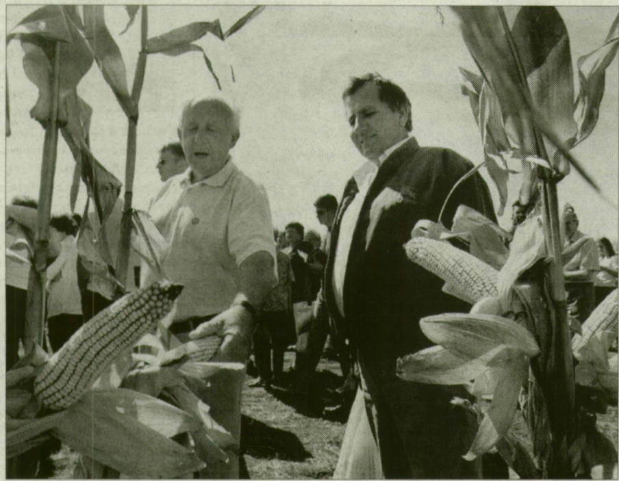
Szemle a GK Kht. újszegedi telepén. Bevitték őket a kukoricásba.

Az országban előreláthatóan 14 millió 700 ezer tonna kukorica vár majd eladásra. Gond, hogy az állatállomány drasztikus csökkenése miatt kevesebb takarmányra lesz szükség, ezért az értékesítési problémáktól egyedül az export mentheti meg a termelőket. Lukács József kifejtette: az EU-csatlakozáskor minden bizonnyal kisebb vetésterületen kell ugyanezt a termésátlagot produkálni, ami azt jelenti, hogy az agrárszakemberek magasabb termelékenységű, javuló hozamokkal számolnak.