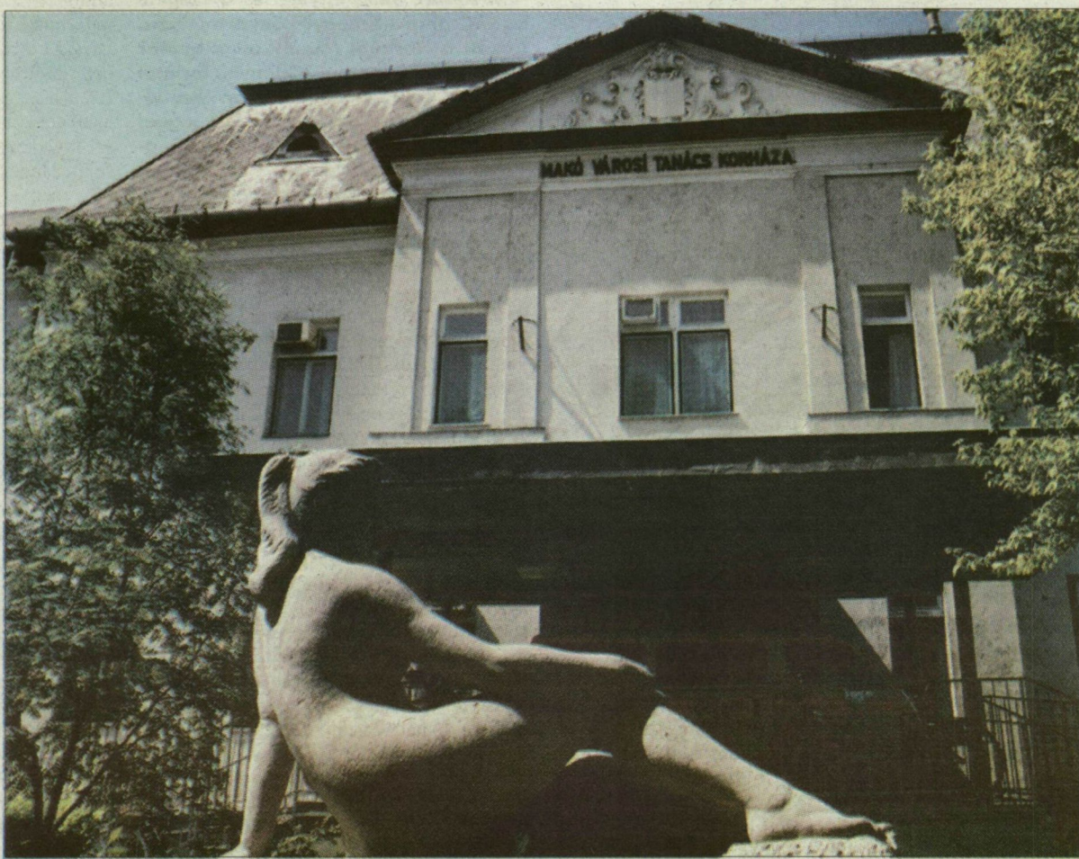
Makói kórházhomlokzat. Egy a három közül.

A megyei főjegyző szerint ha a csekély mértékű támogatás mellett plusz pénzforrásokat nem tudnak bevonni a kórházak működtetésébe, akkor pusztán a működési keretek megváltoztatásának nincs értelme. A megyei közgyűlés a privatizációs törvény megszületését várja kórházai működésének átalakításához.