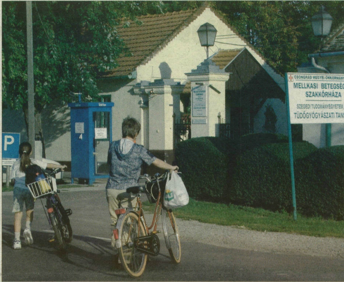
Deszki kórházbejárat. Mindenki a privatizációs törvényt várja.