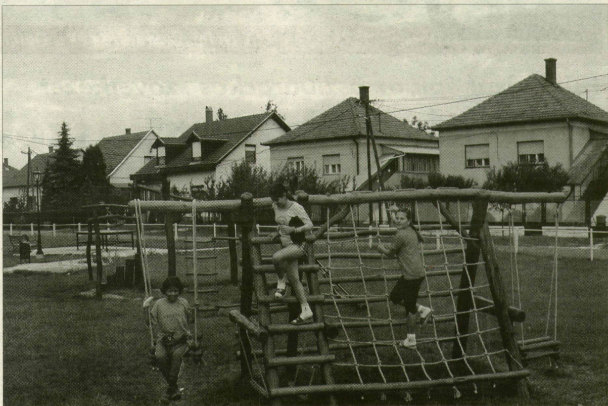
Gázfűtésű házak Algyőn. Pénzt kap a hálózatért az önkormányzat.

Az ÁPV Rt. döntése, mely szerint kifizetik az önkormányzatoknak a gázközművagyon ellenértékét, Csongrád megyében 45 települést érint. Közülük a legtöbbet, 765 millió forintot