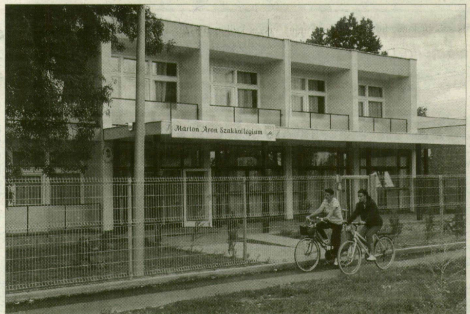
A vitát kiváltó kollégiumba augusztus 8-ától költöznek be a határon túli magyar diákok.

Gettósítást emleget azoknak a határon túli magyar egyetemistáknak egy része, akiket eddigi szálláshelyükről a Szegeden nemrég felújított Márton Áron Szakkollégiumba költöztetnek. A Szegedi Tudományegyetem rektorát elkeseríti a fiatalok ellenállása, mivel az új kollégium a legjobban berendezett diákszállás a városban.