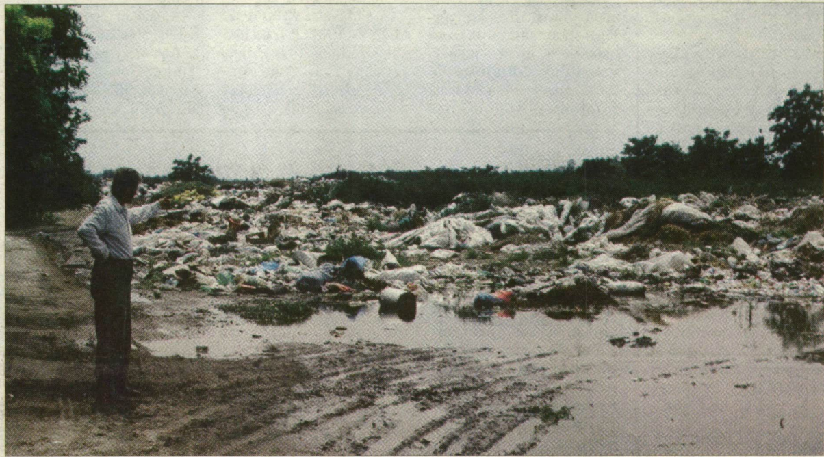
Az illegálisan működő ópusztaszeri szeméttelép. A hulladéklerakót nem is saját, hanem a megye területén üzemelteti a község.

Csak nemrég derült ki, hogy Ópusztaszer község egyébként illegálisan működtetett szeméttelépének tulajdonjoga a megyei önkormányzaté. A Csongrád megyei önkormányzatot a művelési ágától eltérő használat miatt környezet- és földvédelmi bírság fizetésére kötelezik.