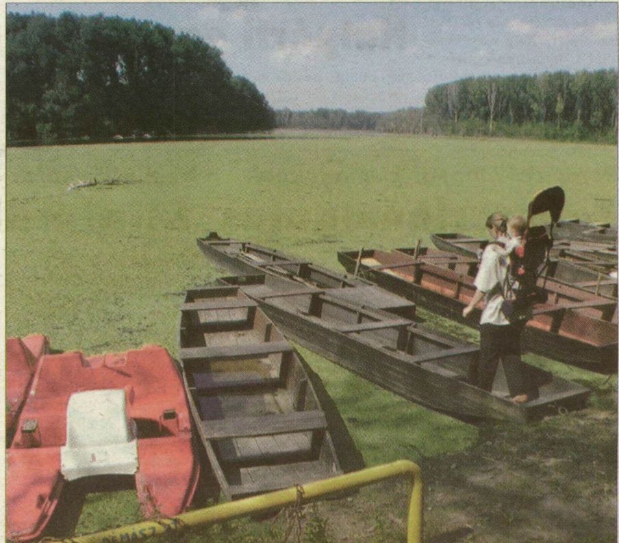
A mártélyi holtágból a burjánzó vízi növényzet kiszorította a horgászokat és a szezon végi fürdőzőket.

Tobzódik a sulyom, a hínár, a békalencse, a rucaüröm a mártélyi holtágban. Egybefüggő, tíz-tizenöt centiméter vastagságú vízínövényszőnyeg borítja a mártélyi horgászásra és fürdésre alkalmas vízfelületet. A nem kívánt növénytakaró megjelenésének oka biológiai. E növények szaporodásának kedvezett az augusztusi hőség, most pedig gyökerük elszakadt a talajtól, és a víz mozgása, valamint az erősebb szél hatására szinte összefüggő felületet alkotva, zöld szőnyegként borítja a vizet a mártélyi üdülőházak és a strand előtt. E jelenség igazolja, mennyire szükség lenne a Tisza mártélyi holtágában a mederkotrásra, az iszap eltávolítására. A jelenlegi rendkívüli helyzetben viszont az is segíthetne, ha a zöld szőnyegyet sikerülne valahogy partra húzni, még mielőtt rothadni kezd a burjánzó növényzet.