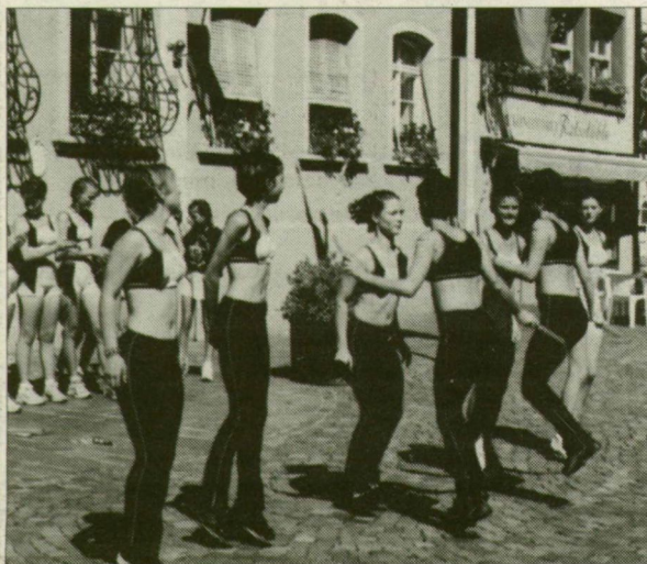
A németországi Waldshut utcáján akcióban a Happy Jumpers

Légszák nélkül már szinte nem lehet autót eladni